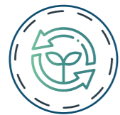
Membrana ECO de 600 GPD